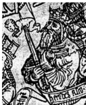
Herodes, de kindermoorenaar.