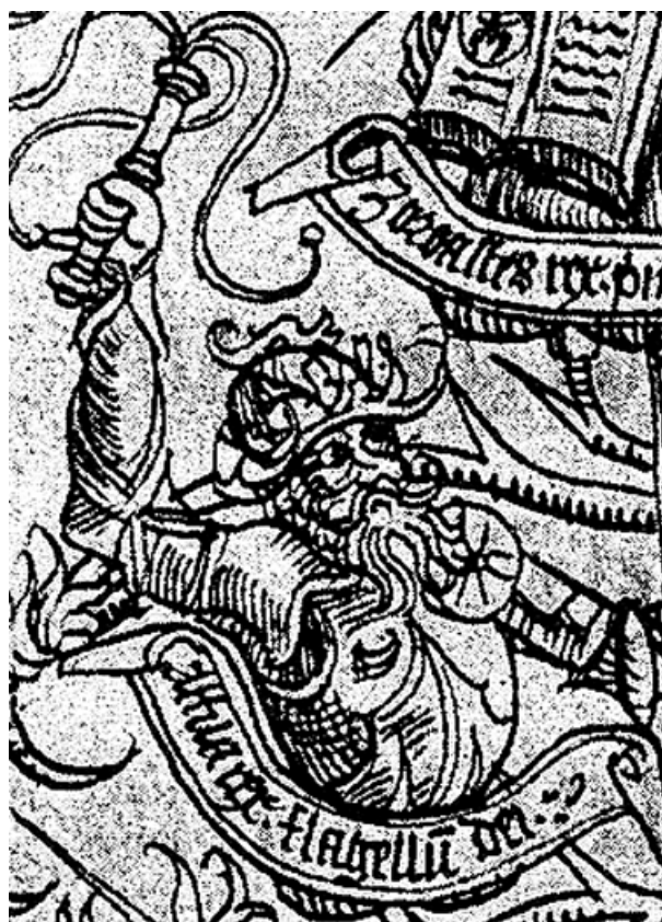
Attila, de gesel Gods.