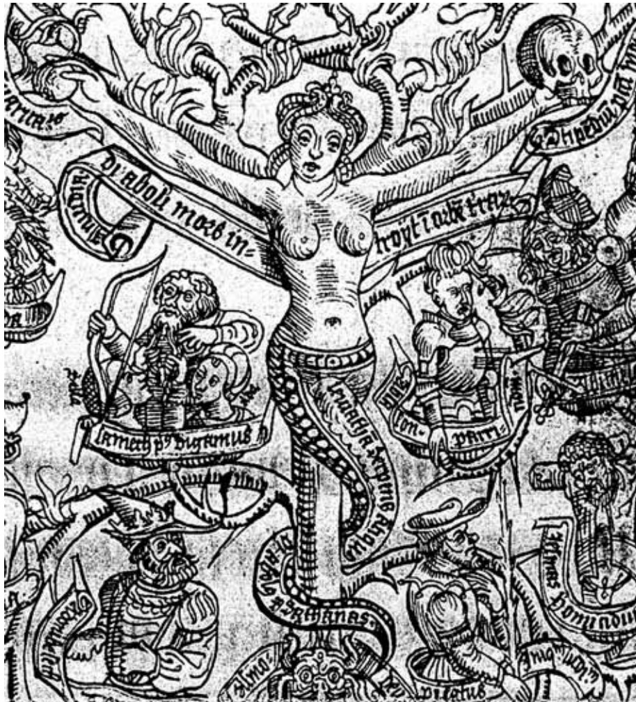
Het zeemonster Leviathan als de slang met het lichaam van een vrouw.