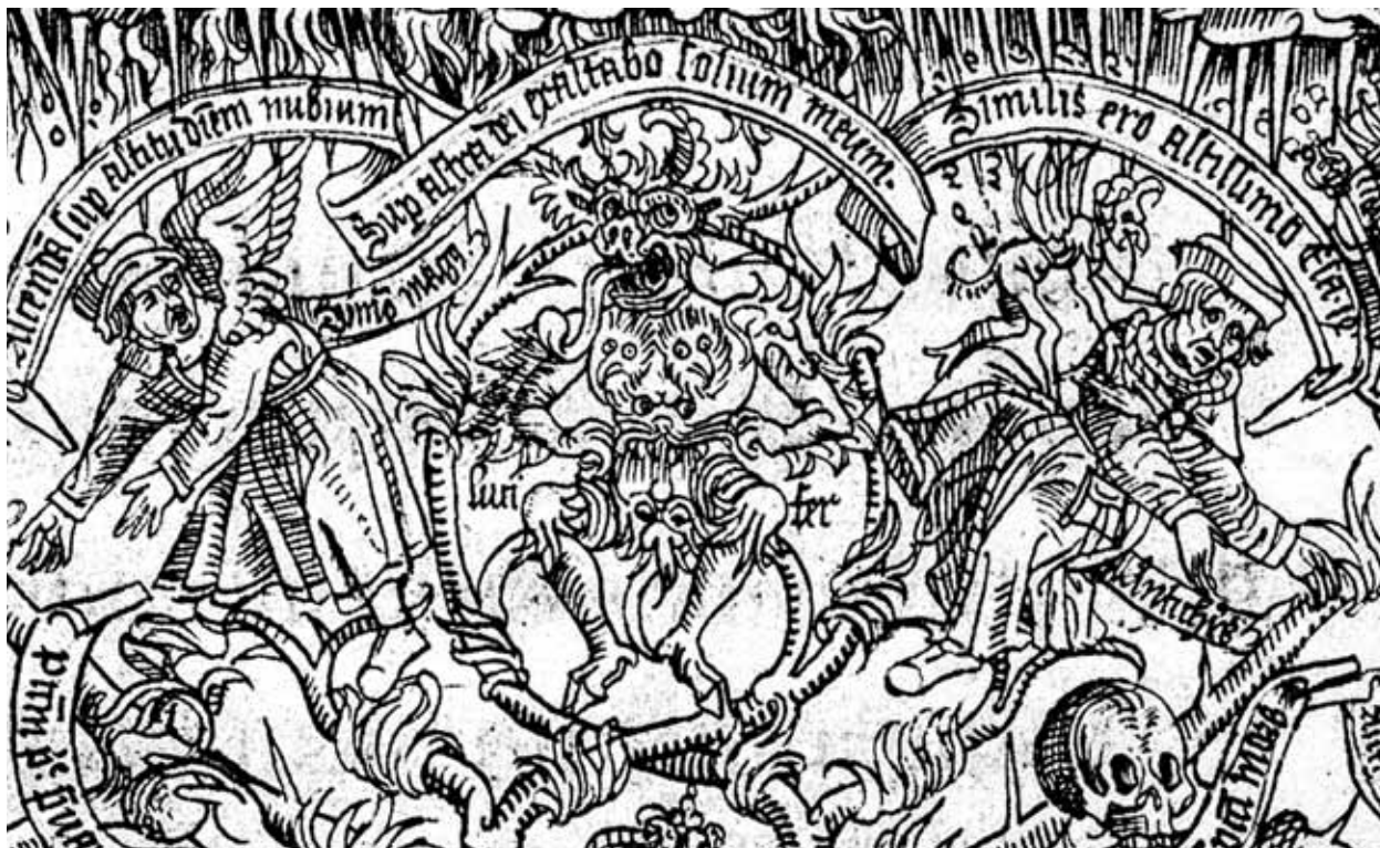
Lucifer met naast hem Simon de Tovenaar en de Antichrist.

Maar waarom werd aan die uit de hemel gevallen aartsengel de naam Lucifer toegekend? In feite wordt het antwoord in de prent zelf gegeven. Want boven