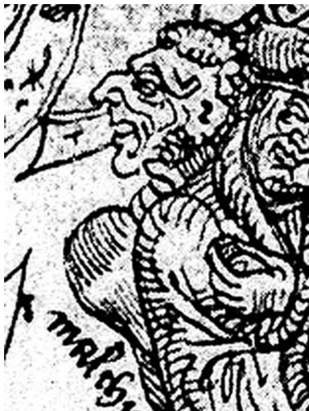
Malchus wiens oor door Petrus werd afgeslagen.