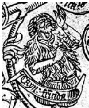
Käin, de broedermoorenaar.

Het bleek overigens niet mogelijk om alle figuren op de prent te identificeren. Enerzijds komt dit omdat de namen soms moeilijk te lezen zijn, mede door veelvuldig gebruikt van afkortingen, en anderzijds omdat meerdere van hen in de literatuur niet zijn terug te vinden. Vandaar onderstaande keuze die hopelijk als representatief voor alle tezamen beschouwd mag worden.